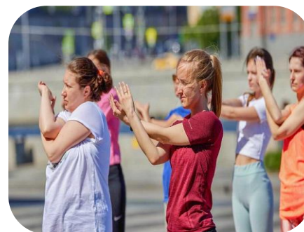
Луганская Народная Республика